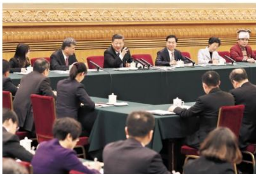
3月7日，中共中央总书记、国家主席、中央军委主席习近平参加十三届全国人大一次会议广东代表团的审议。

习近平充分肯定党的十八大以来广东工作，要求广东的同志们进一步解放思想、改革创新，真抓实干，奋发进取，以新的更大作为开创广东工作新局面，在构建推动经济高质量发展体制机制、建设现代化经济体系、形成全面开放新格局、营造共建共治共享社会治理格局上走在全国前列。