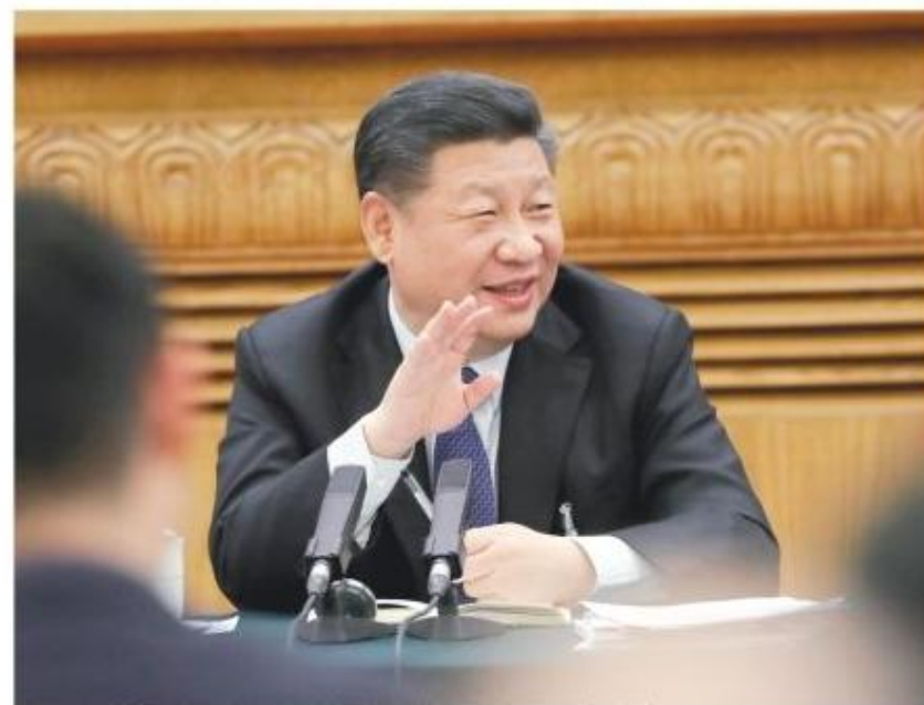
3月7日，中共中央总书记、国家主席、中央军委主席习近平参加十三届全国人大一次会议广东代表团审议。